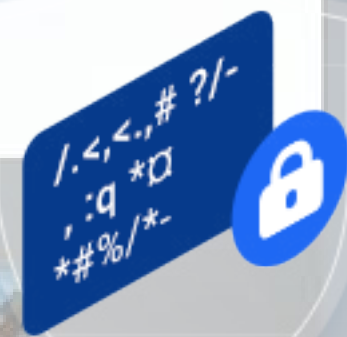
Chiffrement AES 128 bits

Notre priorité absolue est de protéger vos données et votre vie privée. La transmission des données entre la caméra et EZVIZ Cloud est chiffrée de bout en bout. Vous êtes seul à disposer des clés de déchiffrement de vos données.